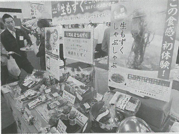
「生もずく」を大々的にPRした大関食品のコーナー